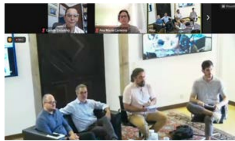
II Congresso Internacional sobre Migração e Diáspora Acadêmica Brasileira (CIMDAB), realizado em julho de 2023, em Portugal