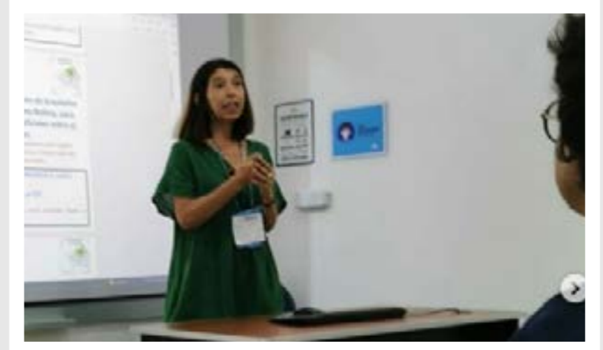
XVIII Congresso Ibercom 2023 realizado em outubro, na Bolívia