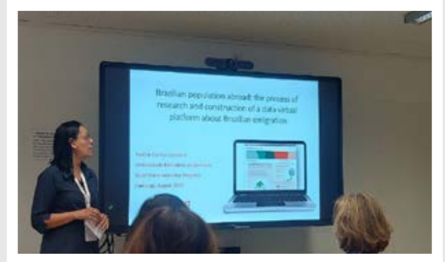
The Migration Conference 2023, realizada em agosto, na Alemanha