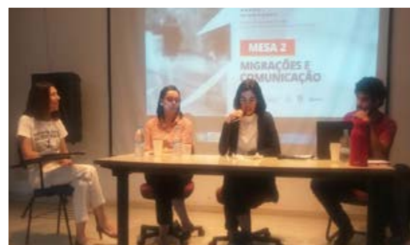
XIX Simpósio de Pesquisa sobre Migrações, realizado em outubro, no Rio de Janeiro