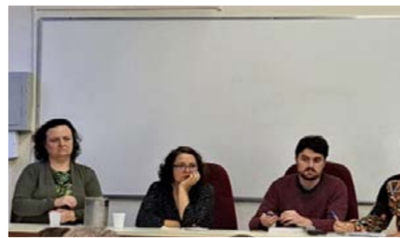
VII Seminário do Núcleo Interdisciplinar de Estudos Migratórios (NIEM), realizado em agosto, no Rio de Janeiro