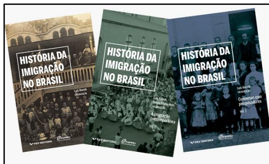
Coleção tem 3 volumes.