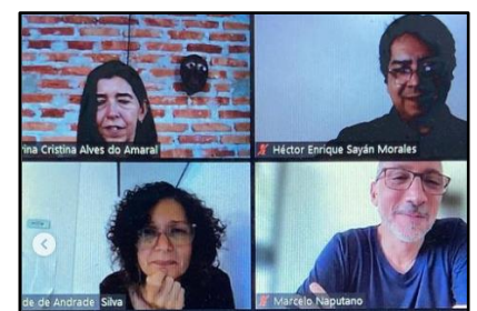
CIMDAB 2024, Portugal